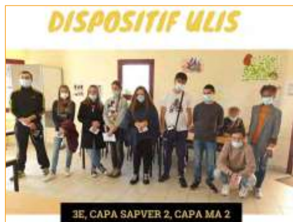
Les jeunes ont élu leur délégué de classe en situation de vote réel à la mairie de Beynac

https://mobile.interieur.gouv.fr/Elections/Comment-voter