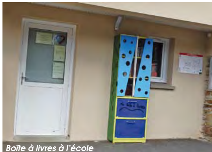
Boîte à livres à l'école

2 – chacun choisit le ou les livres qu'il souhaite emporter pour les lire.